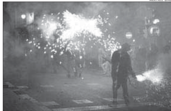
DURANT LA FESTA MAJOR ELS DIAFILES VAN RECÓRRER ELS CARRERS DE LA VILA

comprometre a reparar la Porta de l'Infern, una estructura malmesa en la darrera edició de la Festa Major de la ciutat, si les colles accedien a cremar en el recorregut proposat. Després d'assemblees, reunions internes, múltiples votacions i valoracions d'avantatges i inconvenients, la Malèfica i la Diabòlica van participar al correfoc —malgrat una forta divisió interna— i la Vella va renunciar. En la reunió de la Coordinadora de Di-