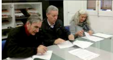
Signatura del conveni amb Egueiro